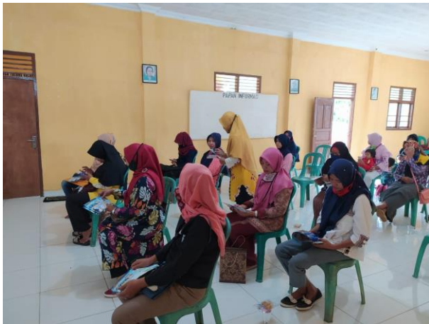
Gambar 5 Peserta Pengabdian