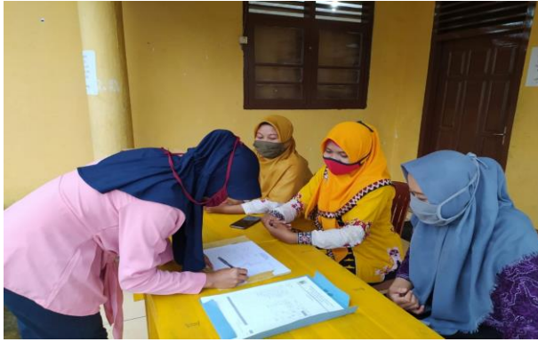
Gambar 1. Registrasi peserta sosialisasi