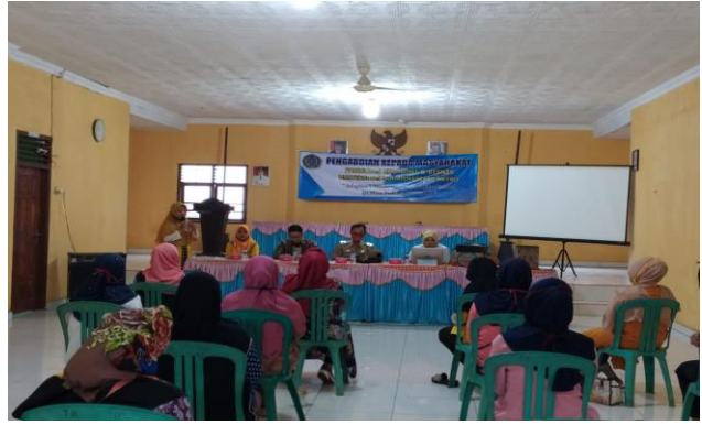
Gambar 2 Pembukaan acara sosialisasi