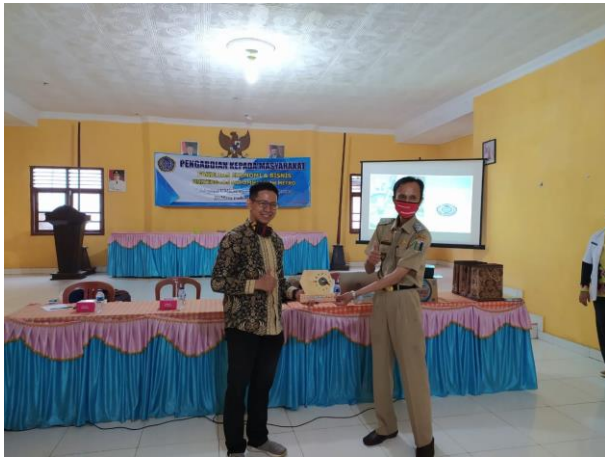
Gambar 3 Penyerahan cendramata oleh Ketua pengabdian kepada kepala desa