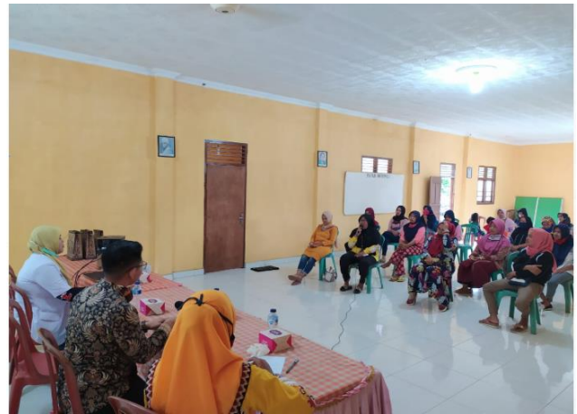
Gambar 6 Penyampaian Materi Pengabdian