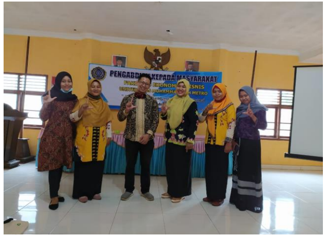
Gambar 4 Tim pengabdian Bersama salah satu mitra